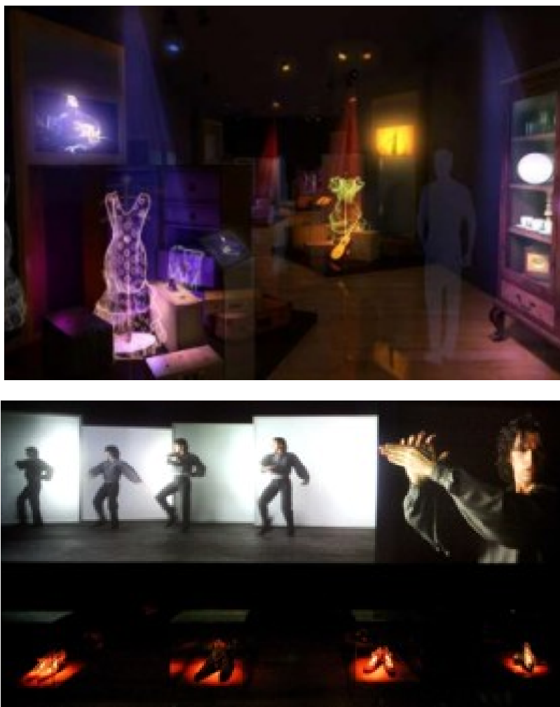
Ilustración 2. Salas del Museo del Baile Flamenco

exposiciones temporales de artes plásticas como pintura y fotografía vinculadas al Baile Flamenco.