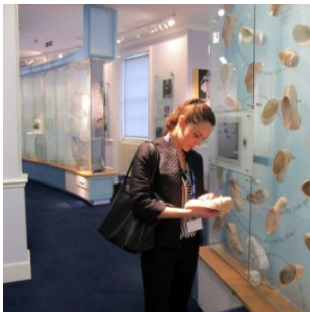
Ilustración 3. Sala principal del White Lodge Museum

En Norte América es posible visitar el Museo Nacional de la Danza y Salón de la Fama,