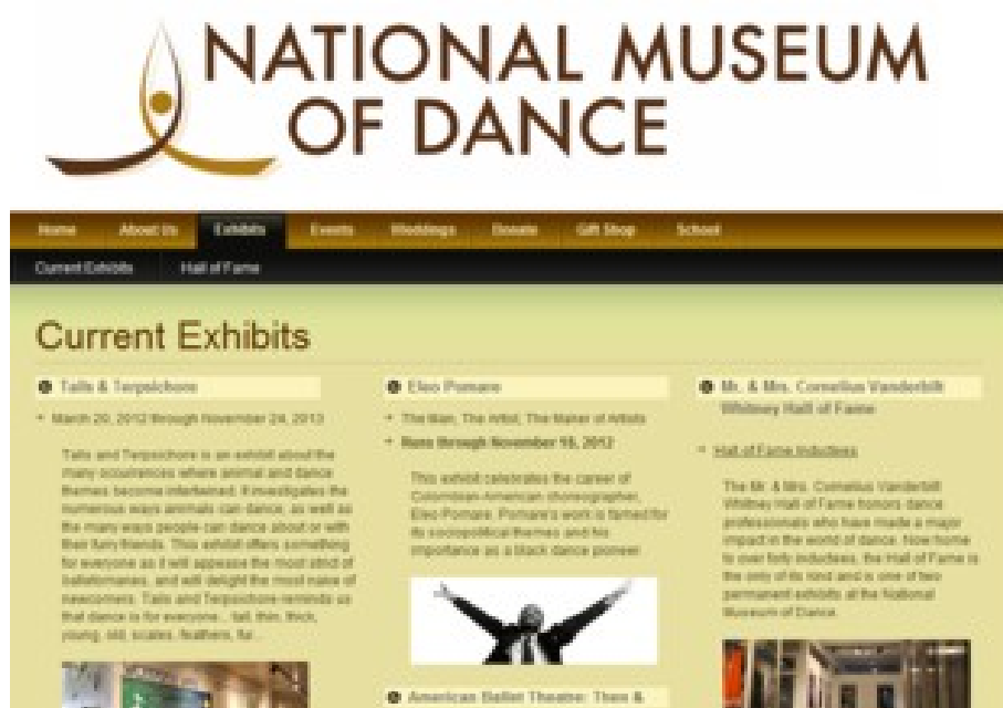
Ilustración 4. Página web del National Museum of Dance

establecido en 1986 como el único museo de dicho país y uno de los pocos en el mundo que se dedica por completo al arte de la danza. El Museo está ubicado en la antigua casa de baños de Washington, un edificio histórico en el Spa State Park Saratoga. El museo cuenta con colecciones de fotografías, videos, vestuario, documentos, biografías y artefactos que hacen honor a todas las formas de la danza a lo largo de la historia. Cuenta con una sala que ofrece miles de libros, periódicos y artículos para la investigación de la danza. A lo largo de las galerías del edificio se encuentra una variedad de exposiciones temporales al año, y tres exhibiciones permanentes que incluyen el Salón de la fama del Sr. y Sra. Cornelio Vanderbilt Whitney, inaugurado en 1987, donde se honra a los pioneros de la danza de todo tipo, ya sean coreógrafos, compositores, escritores, bailarines, o mecenas.