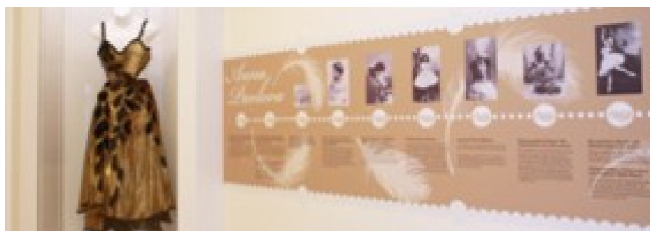
Ilustración 5. Exposición temporal de Ana Pavlova en el National Museum of Dance.

específicamente con el propósito de mantener la danza en vivo. Como parte de la oferta se cuenta con clases magistrales, conferencias, demostraciones, residencias y otros programas, así como una escuela de danza propia del museo.